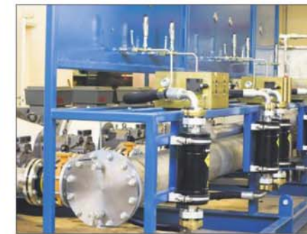
Hydraulikk: Nylig leverte Haugnes & co dette anlegget til Hydranor på Kongsberg, det største selskapet noen gang har produsert.