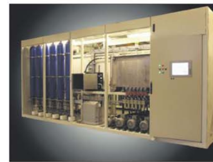
Til Kina: Nylig ble denne hydrauliske pumpestasjonen levert til Nexans i Kina.